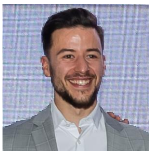
ESCUELAS DEPORTIVAS MC ESTEBAN MAREQUE REY